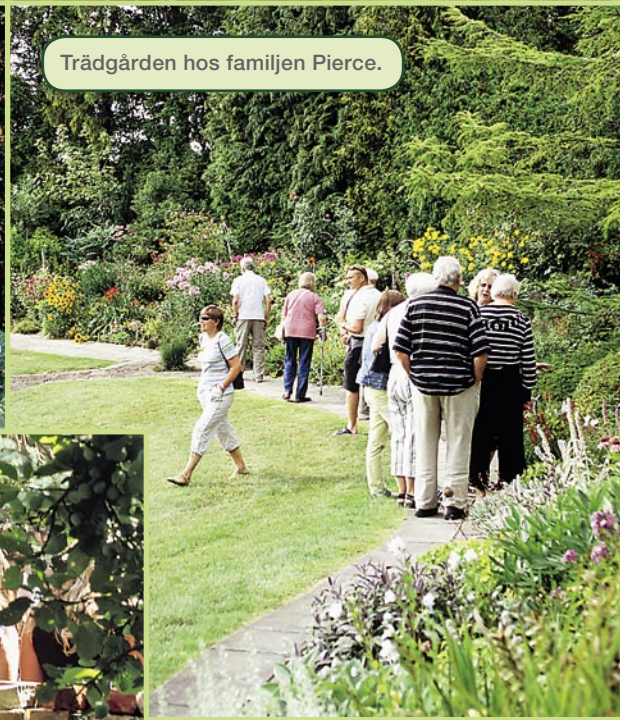
Trädgården hos familjen Pierce.