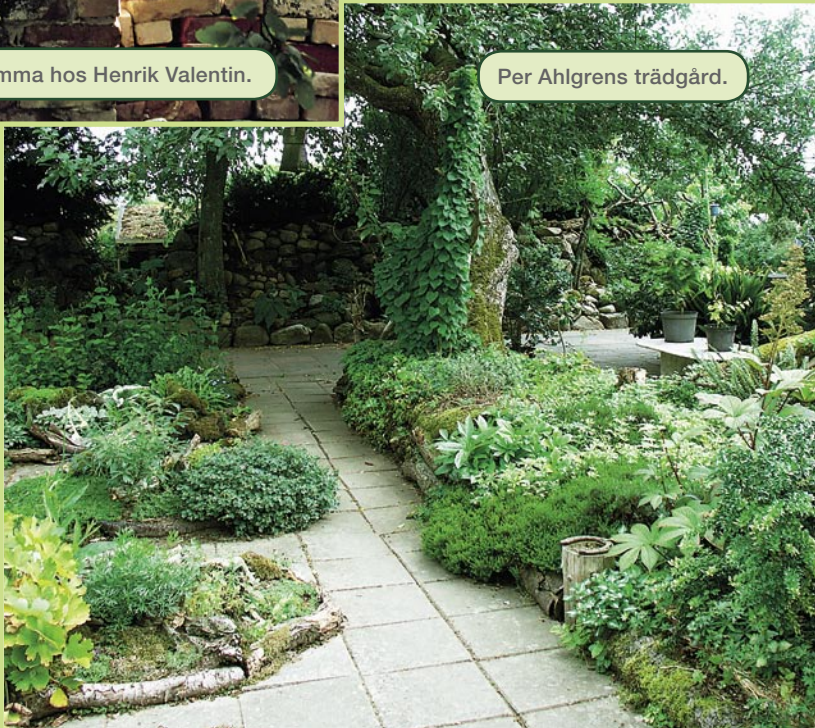
Per Ahlgrens trädgård.