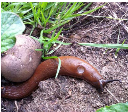
Fullvuxen snigel. Under högsommaren hittar man snigeln i sin kompost där det finns många lättillgängliga växtdelar.

Von Proschwitz, T. (2009). ”Snigel- fridstörare i örtagården, vetenskap och fakta”, Uddevalla, Bohusläns museums förlag.