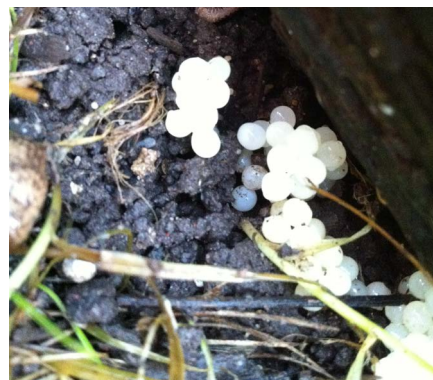
Snigeln lägger sina ägg så att de är skyddade. Här ligger de mellan marken och en gammal stock som ramar in ett trädgårdsland.