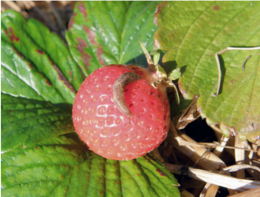
Åkersnigel, Deroceras reticulatum , är en vanlig skadegörare i jordgubbar under regniga somrar.

Nemaslug har inte gett någon tydlig påverkan varken vid vår- eller höstbehandling vilket kan bero på de torra förhållandena under försöksperioderna.