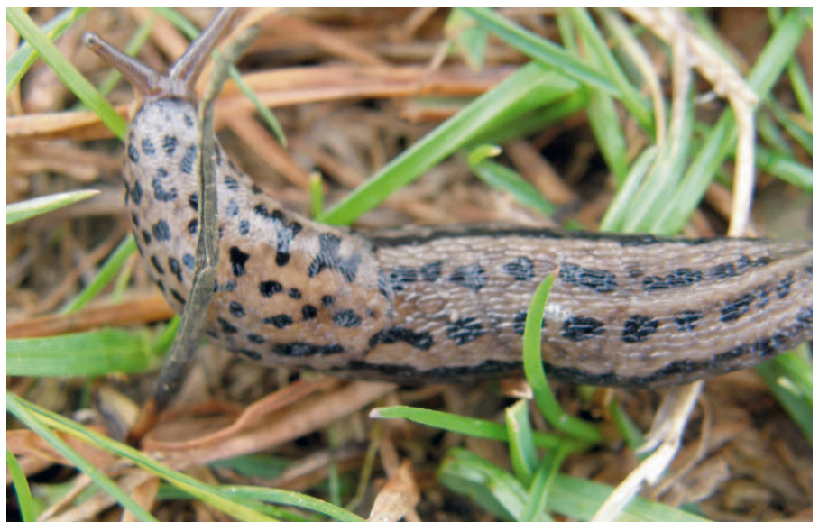
Pantersnigel, Limax maximus , kan lätt förväxlas med spansk skogssnigel, men den är inte lika vanlig.

Nu blev skillnaden mellan obehandlad kontroll och Ferramol signifikant ( p < 0,05 ) men det var ingen skillnad mellan olika doser, figur 1.