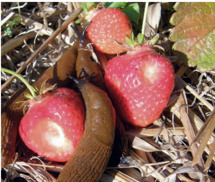
Spansk skogssnigel, Arion lusitanicus , äter gärna av jordgubbar men oftast bara nattetid.

Sniglar är ett ökande problem och den spanska skogssnigeln, Arion lusitanicus , även kallad "mördarsnigel" trivs bra i det svenska klimatet. Milda vintrar och fuktiga vårar är det mest gynnsamma för sniglarnas utveckling. På senare år har den spanska skogssnigeln snabbt spridit sig från trädgårdar till lantbruk och trädgårdsgrödor på friland. Omfattande skador förekom i mindre ekologiska odlingar i Västsverige under säsongen 2007. Även 2008 och 2009 rapporteras om allvarliga problem trots torrare väderlek. Jordbruksverket finansierade 2009 en inventering av snigelproblem i Halland samt ett orienterande bekämpningsförsök i jordgubbar.