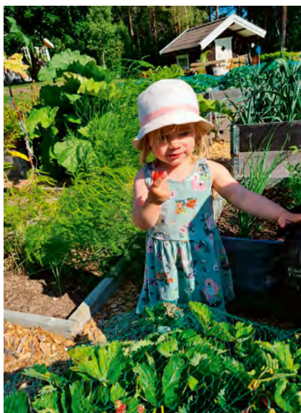
Busstur A och C går till trädgård 6.

Senast den 31 maj behöver vi din anmälan.