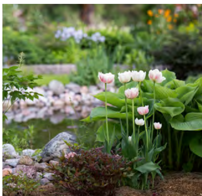
Busstur A och B går till trädgård 7.

Carola och Håkan Lidén har en trädgård som fått växa fram genom åren. Den är på ca 2 000 kvadratmeter och för två år sedan satte de upp ett orangeri. Som regel blir det något nytt varje år och de tycker om att ha mycket ätbart, sådant som man kan smaka på och äta av när man går runt i trädgården.