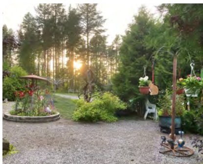
Busstur A och C går till trädgård 1.