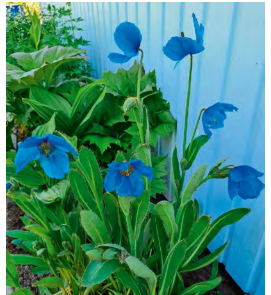
Blå bergvallmo i trädgård nummer 6.

prunkande rabatter och byggnader med snickarglädje. Gården ger utrymme för lek, hälsa och gemenskap i ständig utveckling. Det praktiska ryms bredvid det vackra och trädgården är en plats att längta till och njuta av för hela familjen. Mottot är att odla ätbart på ett hållbart och vackert sätt. Välkomna att titta in på instagramkontot Gårdsliv_kvarnvägen. ▶