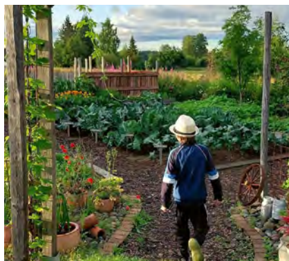
Busstur B och C går till trädgård 5.

Gabriella Nygren, Klutmark 5 På den välkomnande gården odlas grönsaker för självhushållning inramat med