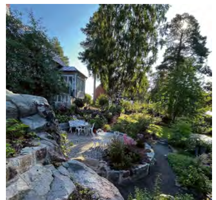
Busstur A och B går till trädgård 3.

utvecklas till min egna oas, säger Helene Löfroth.