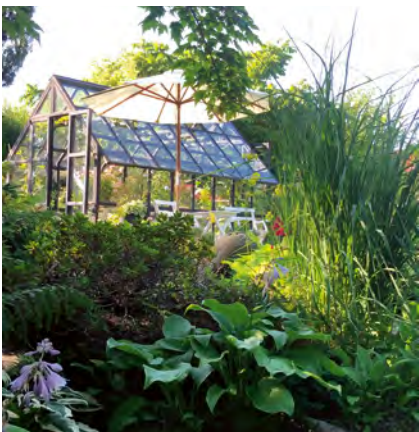
Busstur C går till trädgård 4.

träd och buskar. Här varvas sommarblommor, perenner och ätbart med annat som blommor från tidig vår till sen höst. Trädgården ligger nästan granne med förra trädgården.