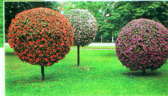
Spektakulära "trädbollar" av flitiga Lisor i stadsparken i Lidköping.