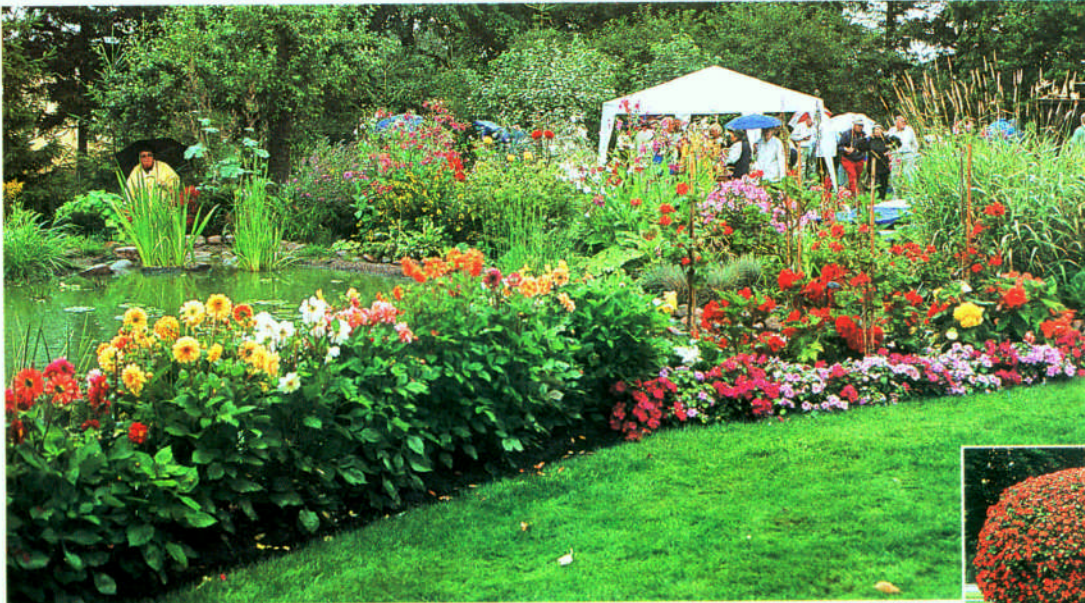
En enorm blomprakt omgav den stora dammen hemma hos familjen Filipsson.