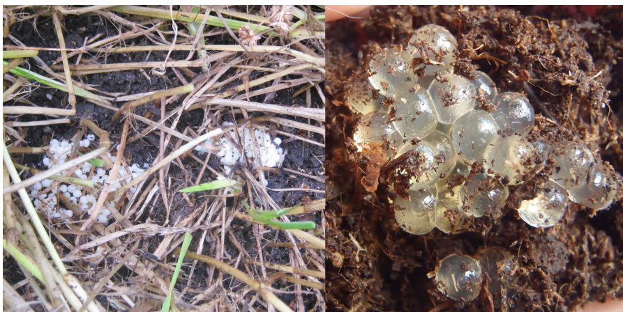
Bild 3. Till vänster, ägg från spansk skogssnigel. Till höger, ägg från panternsigel.