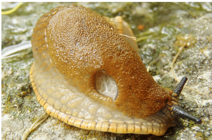
Bild 1. Vuxen snigel. Den spanska skogssnigeln har ett relativt stort andningshål som också fungerar som ändtarm. I änden på de långa tentaklerna sitter ögonen.

Den spanska skogssnigelns diet är en orsak till dess enorma invasions-