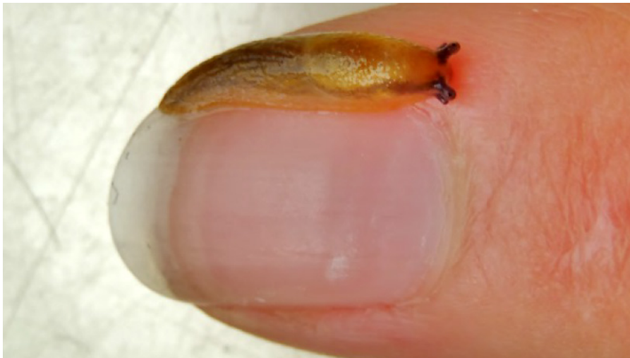
Bild 2. Ung snigel, lägg märke till ränderna på ryggen.