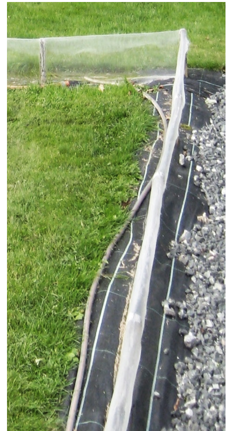
Bild 5. Finmaskigt nätstaket.

I den botaniska trädgården vid universitetet i Bergen, Norge, används en typ av finmaskigt nätstaket för att hindra sniglarnas framfart. Nätet är hårt uppspant mellan staketspinnarna och